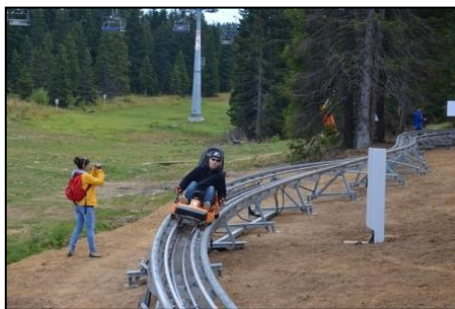
BOB NA ŠINAMA